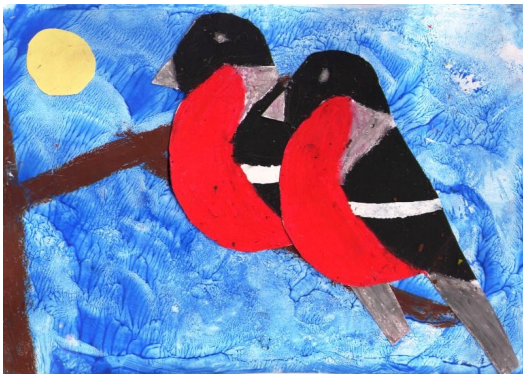
Joonistas Ella Maria Raud

Sõpra ei saa sa osta. Peaksid teadma tema kohta, kas tal kõhu peal on naba või on hoopis kirju saba. Kas krutskeid täis on tema pea või on ta üdinisti hea. Kuid seda ikka meeles pea, sa olema pead sõber hea.