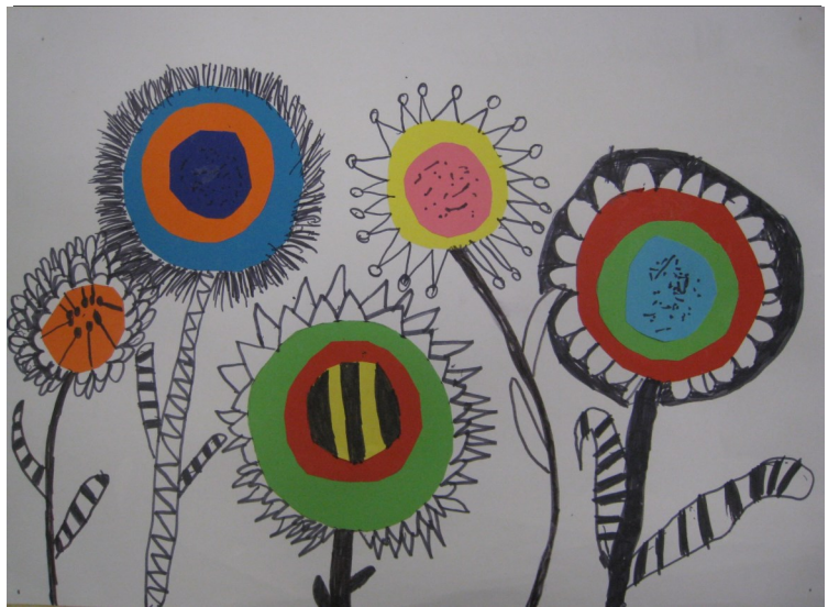
Pildi joonistas Marten Mändma

...on soe ja pehme, ...oskab puhastada kala, ...kallistab ja võtab sülle, ...on raamatusõltlane, ...ostab poest asju ja komme, ...sõidutab mind autoga, ...talle saab kaissu pugeda, ...teeb maailma parimat sööki, ...kardab vihmausse, ...käib minuga ujumas, ...teeb kõige paremaid pannkooke ja vahvleid, ...on sarnane õpetajaga- mõlemad on kurjad ja naljakad, ...teeb koos minuga väga lõbusaid asju.