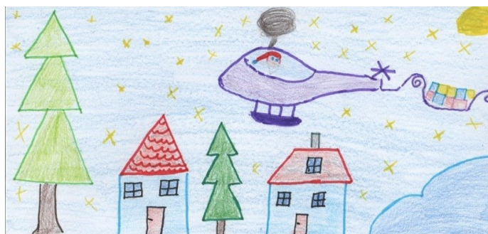
Kaardi joonistas Kariina Täkker