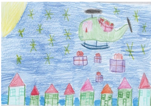
Kaardi joonistas Kaia Põldmaa