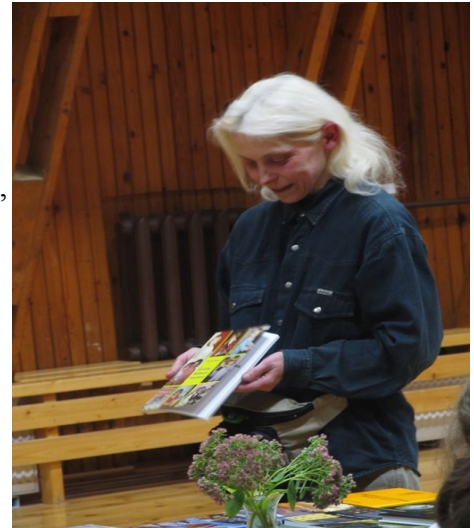
Kirjanik oma raamatuid tutvustamas.